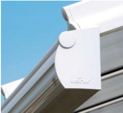
Das Regenwasser wird über die Dachrinne durch die hinteren beiden Pfosten abgeleitet