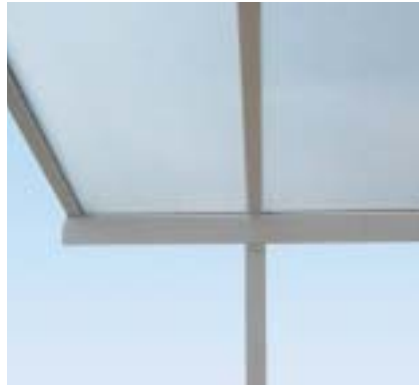
Die Pfosten des WeiTop Carports sind hinten und vorne um eine Dachfelddbreite eingerückt