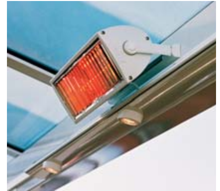
Optional mit Heizsystem Tempura und der Lichtleiste Lux