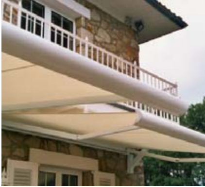
Steuern Sie per Funk Ihre Markisen ...