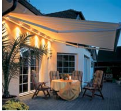
... Ihre Terrassenbeleuchtung Lichtleiste Lux ...