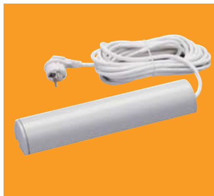
WeiTronic Combo-868 HD 3,0 KW in Designleiste

Der jeweilige WeiTronic Funkempfänger kann für die Steuerung von Markisen oder die des Heizsystems Tempura außen unauffällig befestigt werden. Ihr Vorteil: Im Servicefall tauschen Sie nur den Empfänger nicht den ganzen Motor aus. Zudem ist das WeiTronic System kompatibel zum Elero-Funksystem und dadurch breit einsetzbar.