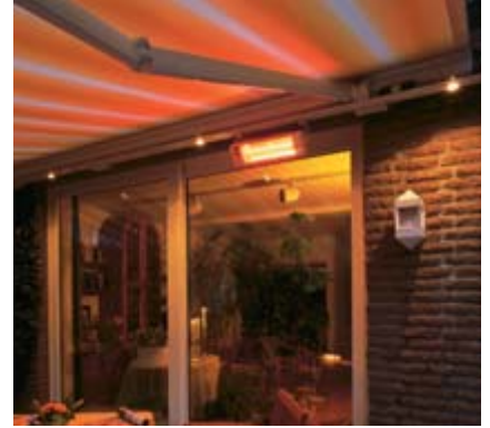
... und zusätzlich Ihr Heizsystem Tempura .